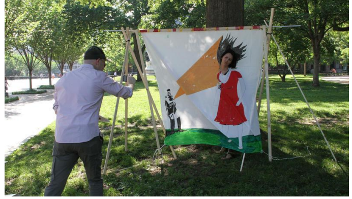
Gezi Parkı hatırası

Burada, birçok alanda bahsedebileceğimiz dönüşümler ve üretimler bizlere kentteki kamusal mekanda ayrıca yer alan hem grafik uygulamalarının, hem mekansal ve malzeme kullanımların, hem de performatif sanatların ifade biçimlerinin nasıl estetik kaygılar dışında ve mimarsız bir devrime dönüştüğünü öğretmiştir. Yeni bir dil ve alfabe ile kentte mekan kavramının yeniden yapılandırıldığını göstermiştir.