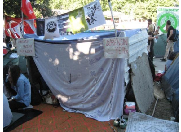
Gezi Parkı, kentte yaşam mekanı kesitleri