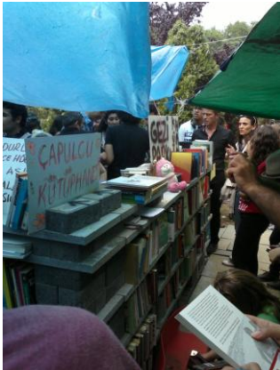
Gezi' de kütüphane

Park, park olarak kalması ve öyle kullanılması içindi, fakat bunu talep sürecinde park ile beraber kentteki birçok kamusal alan alışılmış işlevlerinin ötesine çıkarıldı. Özne ve nesne (mekan-kullanıcı) birlikteliği artık çok farklı tanımlanıyordu. Park içinde kurulan kütüphaneler, bostanlar, bahçeler, yiyecek içecek dağıtan otellerin restoranlarından alışkın olduğumuz uzun masalar... Apartman pencereleri eczane görevi görüyor, camiler birer hastane olmuş, sokaklardaki duvarlar ise sanal mekandaki fikirlerin somutlaşmış bedenleriydi.