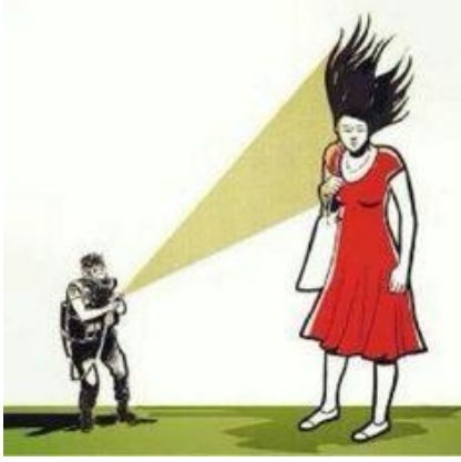
Kırmızı elbiseli kadın karikatürü

oluyordu. Öte yandan, sanal mekan, sadece insanları bir araya getiren, katalizör olan araç değil, kendi içinde de fiziksel mekandaki oluşumların, yaratıcılık ve ifade biçimlerinin elle tutulamayan halini gayet iyi yansıtmıştır. Sanal ve reel müttefikliği ile tanık olduğumuz üretimler bir dijital ekrandaydı, bir kamusal mekanda. Kırmızı elbiseli kadın kimi zaman internette direniş günlüğü tutan bir bloğun logosu, kimi zamanda gezi parkı hatırası arka fonu idi.