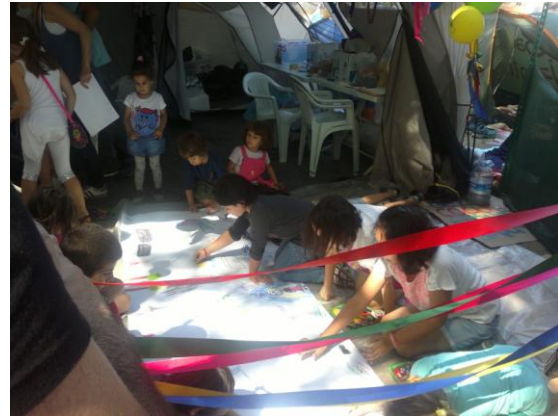
Çocuk oyun alanı