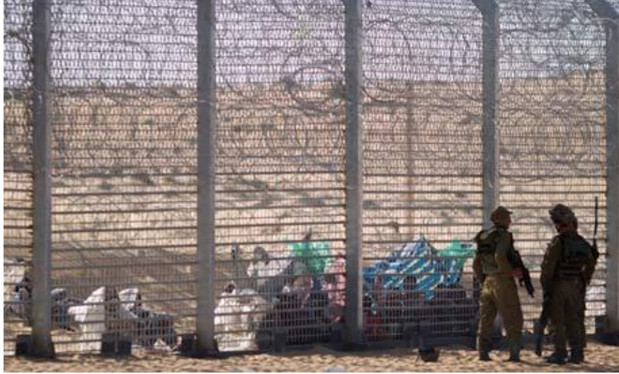
Resim 3: Mısır'dan İsrail'e geçmeye çalışan Afrikalı mülteciler

İsrail'in komşularıyla yaşadığı sınır sorunlarının ürettiği yeni kavramlar tartışılarsun, tekrar Kıbrıs ara bölgeye döndüğümüzde, 2011'de Rum ve Türk kesiminden aktivistlerin, bölünmüşlüğe karşı birleşme, tek Kıbrıs olma amacıyla Lokmacı Kapısı'nda başlattıkları "Occupy Bufferzone 5 " (Resim 4) eylemi ve 6 ay sonra Kıbrıs polis kuvvetleriyle dağılması da kimlik değiştirme politikası bakımından önem taşır. Burada önemli olan, polis kuvvetlerinin uyuşturucuyla [anti-drug] ve terörle mücadele [anti-terrorist department] ekiplerin olması ve işgalcilerin –bu işgalin yasal olup olmaması değildir tartışılan- kimliklerinin, anti-terörist ekiplerinin gelmesini gerektirecek kadar değişmesi ve bunu bir mekânın ve mekânın gerektirdiği bir eylemin üretmesidir.