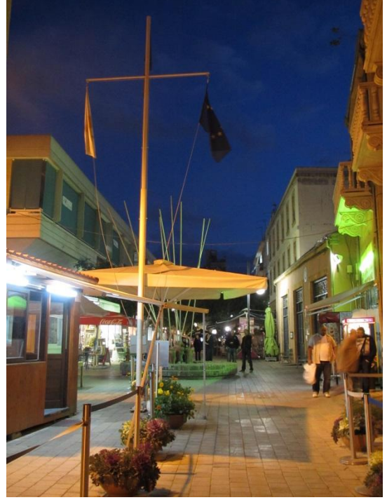
Resim 2:Lokmacı kapısından Rum tarafı

Bir makalelerinde Pohl ve Reyes, sınırların kimlik değiştirme politikasına dikkat çekerler ve hızlı bir biçimde değişen sınırlar ile hayatımıza giren göçmen, tartışmalı bölge, vatansız gibi kavramların üzerinde dururlar 3 . Bu tür yeni kavramlar bakıldığında, siyaset ve uluslar arası ilişkilerde de yeni tartışmalara gebe bırakılır. İsrail-Mısır arasında kalan bölgedeki göçmenlerin ne Mısır ne de İsrail tarafından kabul edilmemesi 4 –sınırlar gereği-, göçmenlerin statüsünü değiştirmiş, arada kalmış, bir nevi vatansız olmuşlardır (Resim 3).