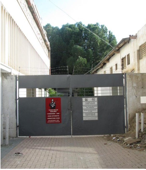
Resim 1:Türk kesiminden ara bölge askeri sınırı

bölgede, Lokmacı/Ledra kontrol kapısının Rum kesiminin başladığı yerde çekilmiş ve çeken kişiye o noktadan öteye geçmemesi gerektiği söylenmiştir. Böyle bir durumda insanda kural, sınır ihlali yaparak arkasına bakmadan koşma isteği ortaya çıkar. Sınır mekânın/çizgisinin bu denli içinde/üstünde olmak, insanı doğasıyla ve kurallarıyla bir çelişkiye iter ve devamlı o geçme 'deneme'sini telkin eder.