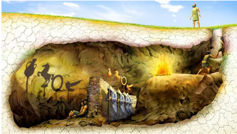
Platonun Mağara Analogisi

Bu çizilen çerçeve içinde sosyal mekan ve sosyal mekan aracılığıyla yapılan eleştiri, fiziksel olarak mekanda bulunmayı ve katılımı; yani yere ve özneye bağlı bir gerçekliği gerektirmektedir. Fiziksel mekana dahil olmadan bu eleştiriye karşı çıkan topluluğun oluşma nedeni nedir? Bunu açıklamak için Platon'un mağara analogisinden bahsedebiliriz sanırım.