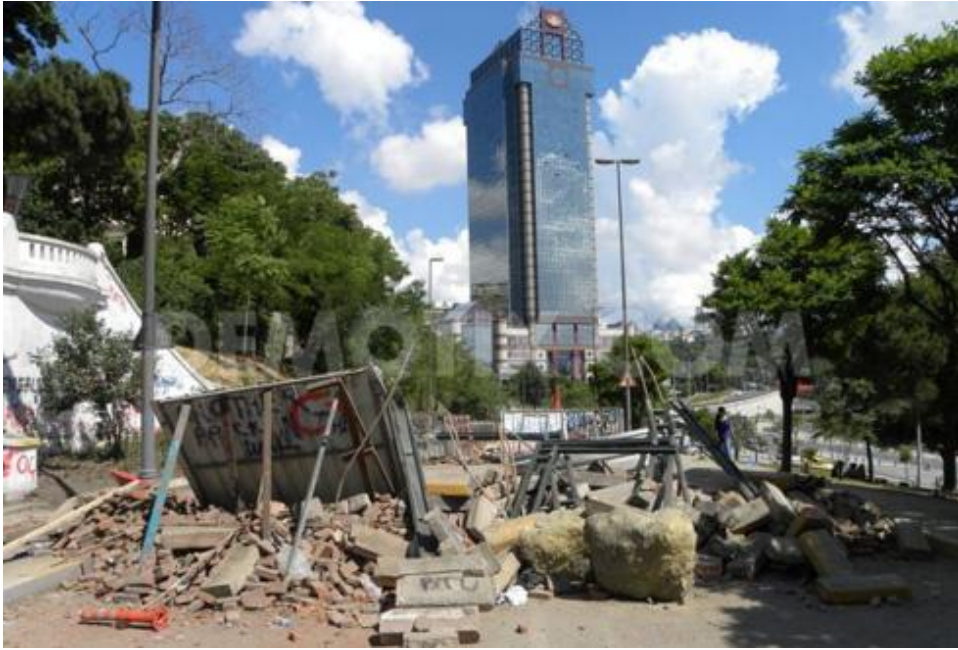
Dolmabahçe'de Barikatlar

İktidar, zaman içerisinde askeri, ekonomik, teknolojik her türlü değişime ayak uydurmakla kalmayıp, her oluşumu, her düzeni de, ideolojik eylem alanı olarak yeniden kurgulamaktadır. Bu anlamda, geniş alanların hakimiyetinde kendisine yer arayan iktidar, bu arayışını mekanlara, ve zamanla mekanın da ötesine mekanlara ait simgesel değerlere kaydırmıştır. İktidarın; bireylerin ve toplumun düzeni, denetimi ve kontrolü için mekanlarda kurmaya çalıştığı hakimiyet, insanların da, özgürlüklerini, bireysel ve toplumsal hak mücadelelerini, bu mekanlar ile geri alabilme mücadelesini ortaya çıkarmıştır. Burada ideolojik krizlerin mekan üzerinden çözülmeye çalışıldığını görüyoruz. Böylelikle “mekan”lar orayı düzenleyen ve kontrol edenle, üzerinde yaşayanlar arasında bir mücadele alanına dönüşmüş oldu. Bu durum aslında mimari eleştiri için uygun bir bağlamın oluştuğunun göstergesidir. Gündelik hayatın ve sistemin çok önemli bir parçası olan mekan ve kentler, dolayısıyla mimarlık ve planlama böyle bir odaklanmayı hak ediyor kuşkusuz.