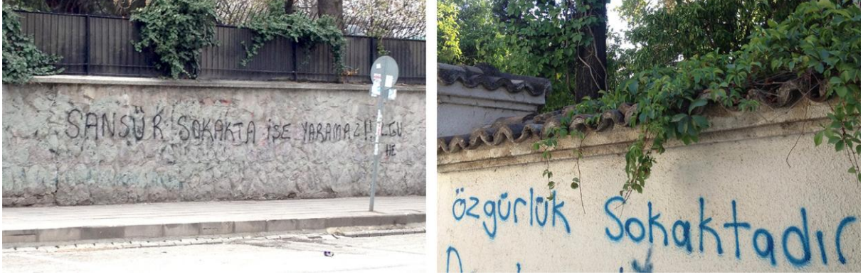
Fotoğraf 2.: Şehirden duvar yazıları: 'sansür sokakta işe yaramaz!' ve 'özgürlük sokaktadır'

Sokak her zaman kentlinin isteklerini, söylemlerini dışı vurmak için kullandığı uzam olmuştur. Aynı zamanda siyasi erke cevap vermek, sesini duyurmak için de sokağı kullanır.