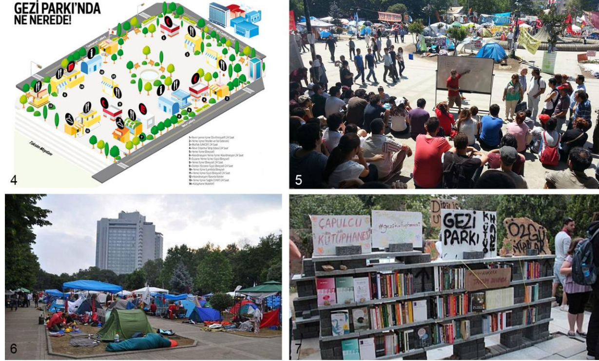
Fotoğraf 4.: Gezi Parkı işgal krokisi, yeniden şekillenen mekansal organizasyon

Bir mekanın ancak yaşayanlarla varolabileceğinin ve gerçek anlamda canlı kalabileceğinin de göstergesi oldu Gezi Parkı'nda oluşan yeni yaşantı ve mekansal organizasyon. Kısa sürede parkta spontane oluşan mekansal organizasyon kendi park haritasını bile oluşturdu.